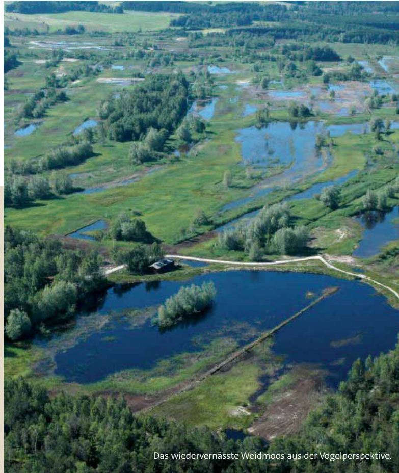
Das wiedervernässte Weidmoos aus der Vogelperspektive.

Diese Maßnahmen haben das Weidmoos langfristig als wichtiges Rückzugsgebiet für seltene Vogelarten gesichert.